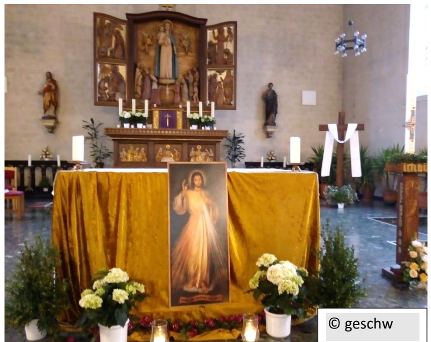
Maria Himmelfahrt Humes